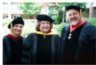
School of Theology

Hier eine Bildschirmaufnahme von Joyners Schule der Theologie in der MorningStar Univerität.